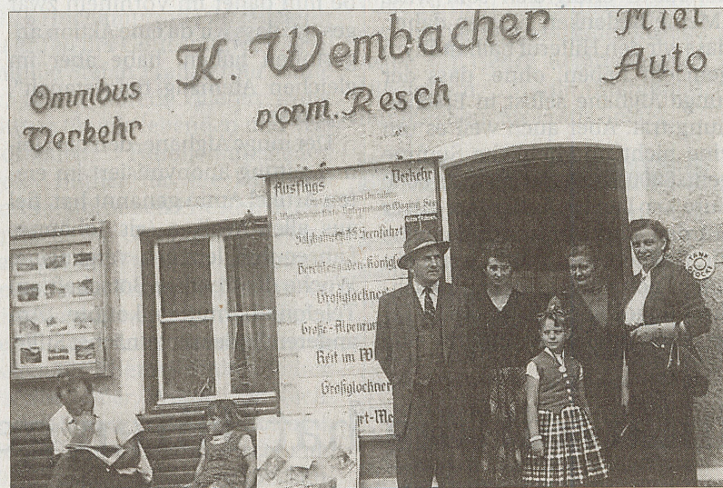
In den 50er Jahren, im Türstock (rechts) die Mutter des Unternehmers.