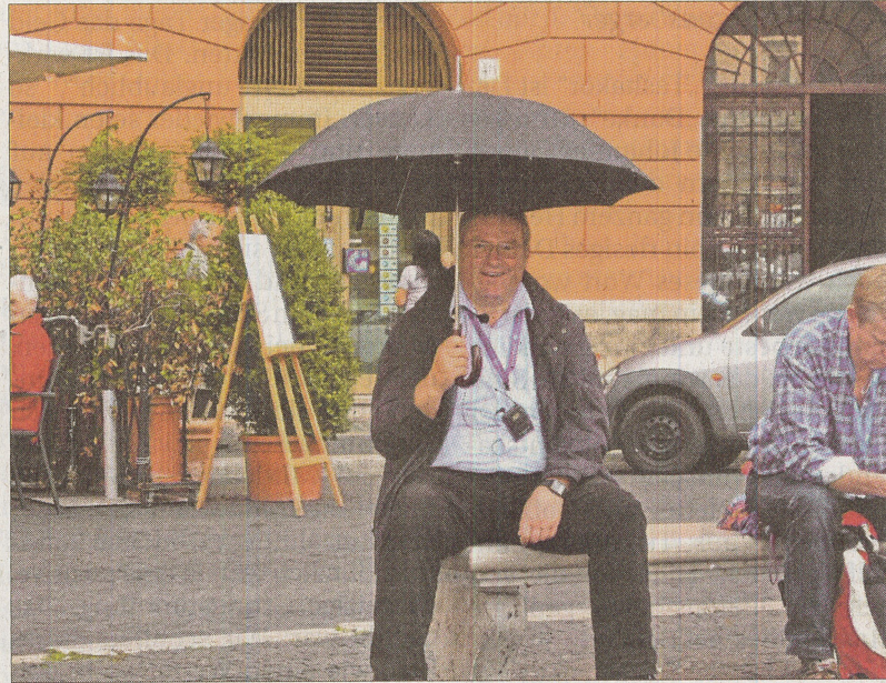
... und gut beschirmt in Rom.